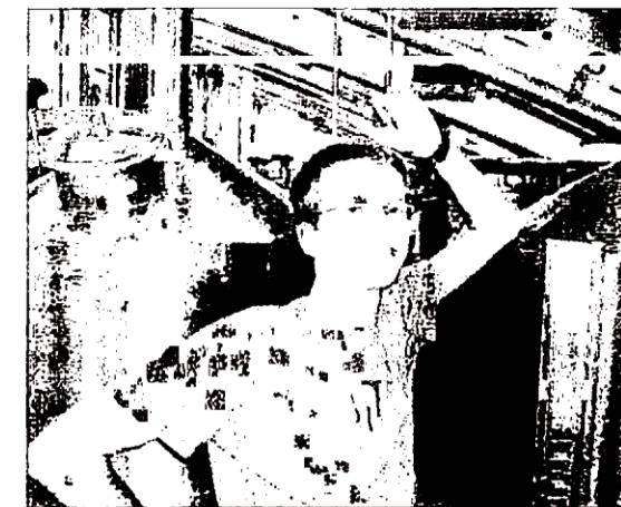
Leur rêve : s'implanter au Nouveau Monde, où tous deux ont grandi.